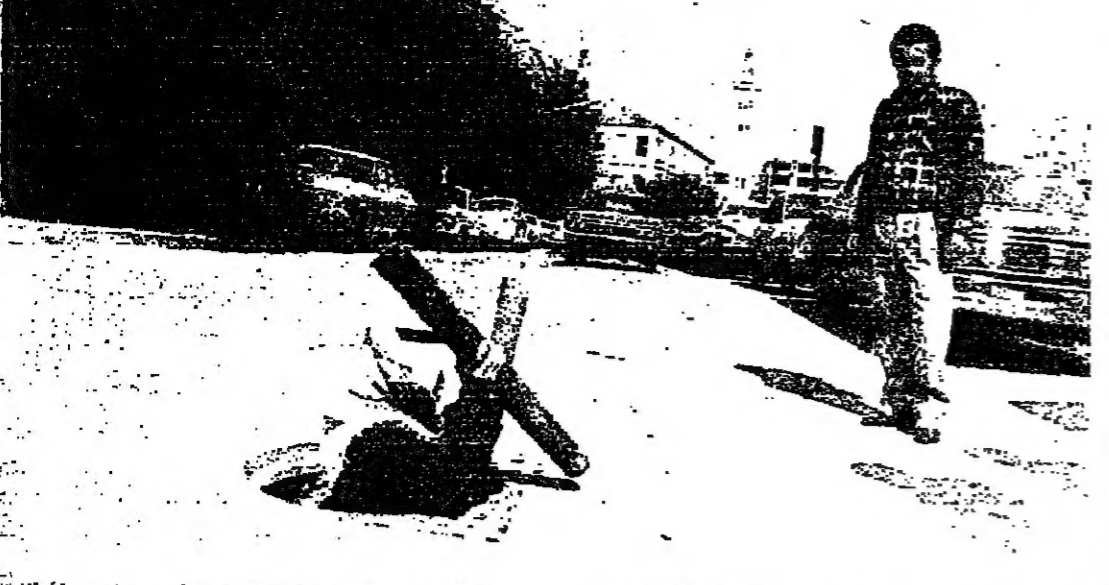
كابلات خطوط السراي